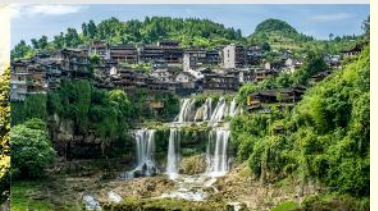
หมู่บ้านโบราณฟูหลงเจิน

*ทางบริษัทฯ ขอสงวนสิทธิ์ในการสลับโปรแกรมทัวร์ตามความเหมาะสมขึ้นอยู่กับสถานการณ์หน้างาน โดยคำนึงถึงผลประโยชน์ของลูกค้าเป็นสำคัญ