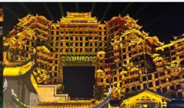
ตีทมหัตศวรรษ 72