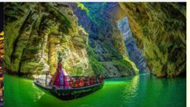
แกรนด์แคนยอนผิงซาน

*ทางบริษัทฯ ขอสงวนสิทธิ์ในการสลับโปรแกรมทัวร์ตามความเหมาะสมขึ้นอยู่กับสถานการณ์หน้างาน โดยคำนึงถึงผลประโยชน์ของลูกค้าเป็นสำคัญ