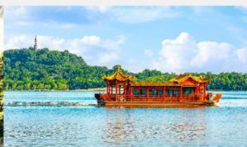
ล่องเรือทะเลสาบหลิวเยว่หู