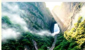
ประตูล้อมรั้ว