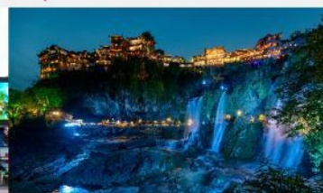
ฝูหรงเจิน

*ทางบริษัทฯ ขอสงวนสิทธิ์ในการสลับโปรแกรมทัวร์ตามความเหมาะสมขึ้นอยู่กับสถานการณ์หน้างาน โดยคำนึงถึงผลประโยชน์ของลูกค้าเป็นสำคัญ