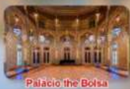
Palacio the Bolsa