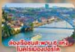
ล่องเรือชมสะพาน 6 แห่ง ในคูร์เมืองปอร์โต