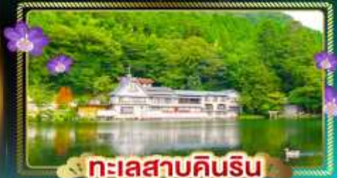
ทะเลสาบคินริน