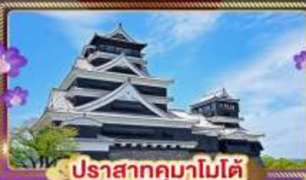
ปราสาทคุมาโมโตะ