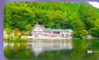
ทะเลสาบคินริน