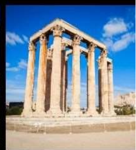
Temple Of Olympian