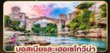
บอสเนียและเฮอร์เซโกวีนา