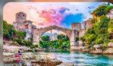
บอสเนียและเฮอร์เซโกวีนา