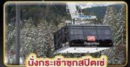
นั่งกระเช้าชุกสปีตซ์