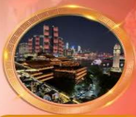
มื้อค่ำร้านอาหารอวฮ์ลั๊กล้าม