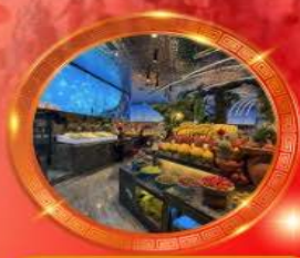
มื้อพิเศษ บุฟเฟต์นานาชาติ