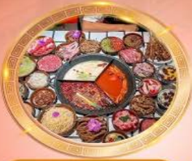
บุฟเฟต์หม้อไฟลงชิ่ง