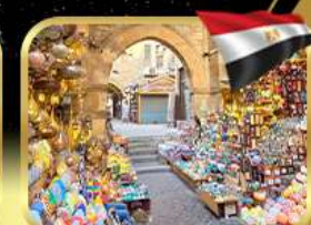
ตลาดชานเอลคาลิลี