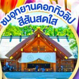
ชมอุทยานดอกทิวลิป สีแสนสดใส