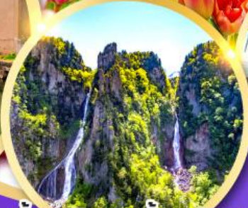
น้ำตกกิงกะ-น้ำตกริวเซ