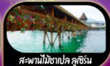
สะพานไม้ชาปค ลูซิิร์น