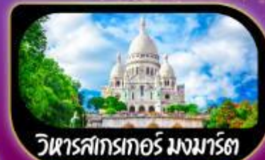
วิหารสกรทอร์ มงมาร์ต