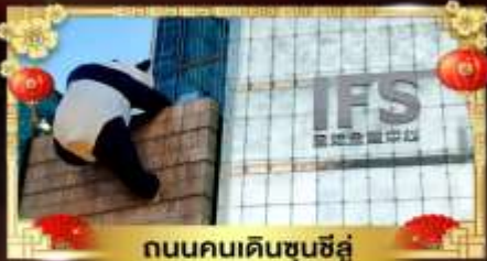
ถนนคนเดินชุนชี่อู่

เที่ยวอุทยานสวรรค์ระดับ 5A จี๋จ้ายโกว "กู๋เจาสีดรุณี" อุทยานชื่อดังเหนียงชาน