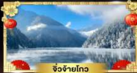
จี๋จ้ายโกว