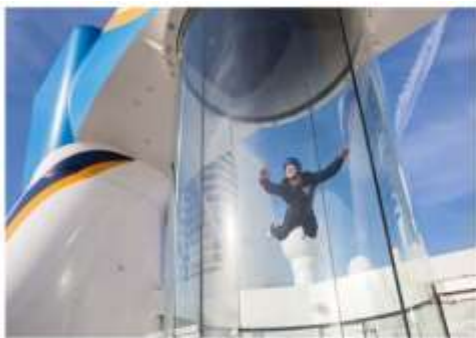
RIPCORD® BY IFLY®